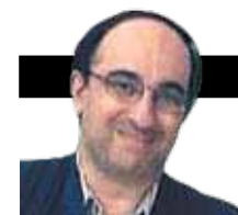
ΓΡΑΦΕΙ Ο ΜΙΧΑΛΗΣ ΠΑΓΚΑΛΟΣ

Η εισαγωγή που δίδαξε η Κορίν Πελλυσόν στο έργο του κορυφαίου φιλοσόφου σε ένα σεμινάριο που το παρακολούθησαν κυρίως γιατροί, ψυχολόγοι και νοσηλευτές, στο πλαίσιο του εκπαιδευτικού προγράμματος «Ουμανισμός και Ιατρική» του Πανεπιστημίου Gustave-Eiffel