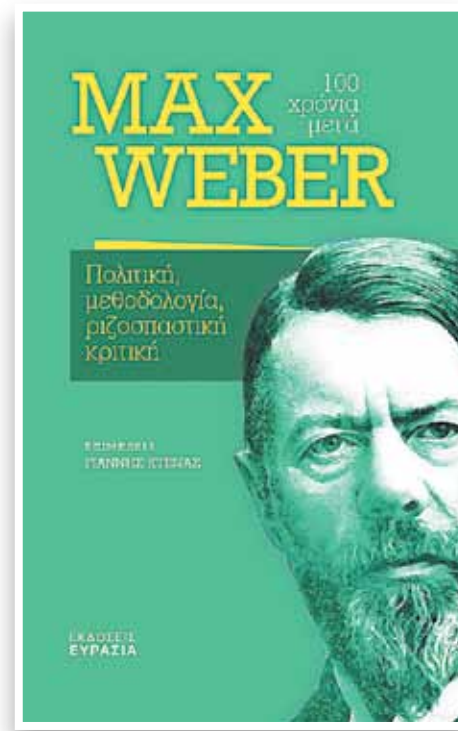
Το εξώφυλλο του συλλογικού τόμου «Max Weber, 100 χρόνια μετά» (εκδ. Ευρασία)

Εφόσον όμως είμαστε τόσο βυθισμένοι μέσα στο γραφειοκρατικό σύστημα, υπάρχει τρόπος να ξεφύγουμε ή ακόμα και να το ανατρέψουμε; Ο Max Weber υποστηρίζει ότι η ιστορία είναι ένα διαρκές γίνεσθαι,