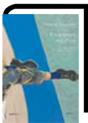
ΝΤΙΝΤΙΕ ΕΡΙΜΠΟΝ Επιστροφή στη Ρενς Μετάφραση Γιάννης Στεφάνου. Εκδόσεις Νήσος, 2020, σελ. 248, τιμή 19 ευρώ