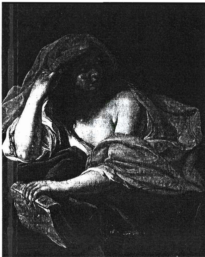
1. Giacinto Brandi (1621-91), «Αλληγορία της φιλοσοφίας».

θειας είναι κάτι που έλαβε χώρα εντός αυτού που οι αρχαίοι Έλληνες αποκαλούσαν πόλιν , τη δημόσια σφαίρα της πολιτικής ζωής. Η φιλοσοφία ήταν μία κατ' εξοχήν πρακτική δραστηριότητα, η οποία είναι εμφανώς διαφορετική από τη συντριπτικά θεωρητική έρευνα που έχει κυριάρχησε από το 17ο αιώνα και μετά.