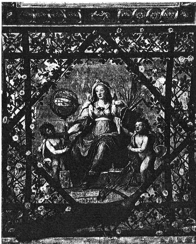
2. Frederico Zuccari (1540-1609), «Σοφία».

λυτική φιλοσοφία. Αν και θα ήταν σωστό να ειπωθεί, στο δικό μου πλαίσιο, ότι ένα μεγάλο μέρος της τελευταίας κυριαρχείται από το ζήτημα της γνώσης, που συλλαμβάνεται επιστημονικά ή φυσιοκρατικά, εις βάρος του ζητήματος της σοφίας, αυτό δεν θα εξηγούσε μία μορφή όπως ο Λούντβιχ Βίτγκενσταϊν [Ludwig Wittgenstein], για παράδειγμα, του οποίου η τεράστια γοητεία ως στοχαστή μπορεί να υποστηριχθεί ότι βασίζεται στον τρόπο με τον οποίο η φιλοσοφική αλήθεια συμβαδίζει με μία ορισμένη σύλληψη του υπαρξιακού νοήματος, με έναν ορισμένο τρόπο ζωής. Δηλαδή η εμπύκνωτική επιθυμία στο έργο του Βίτγκενσταϊν δείχνει να είναι θεραπευτική. Συνεπώς, ας δεχθούμε ότι η προσπάθεια να γεφυρωθεί το χάσμα μεταξύ γνώσης και σοφίας δεν είναι επαρκής όρος για να διακρίνουμε μεταξύ αναλυτικής και πειρωτικής φιλοσοφίας. Όμως δεν είναι αυτό το ζήτημα. Ο γενικός μου ισχυρισμός είναι ότι η απόπειρα να γεφυρωθεί αυτό το χάσμα οφείλει να είναι αναγκαίος όρος για όλο το φιλοσοφείν.