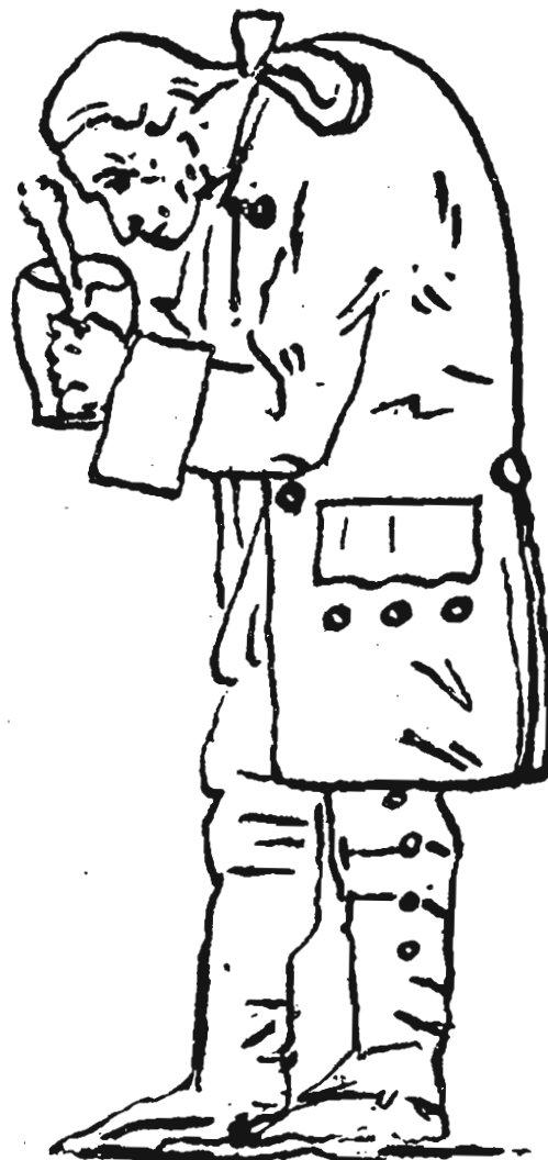
7. Ο Καντ ενώ ανακατεύει μουστάρδα σε δοχείο. Σχέδιο του Friedrich Hagemann (1801).

Θα ολοκληρώσω επιστρέφοντας στον προηγούμενο ισχυρισμό ότι ο Καντ μάς κληροδοτεί μία σειρά δυϊσμών που έχουν ανάγκη ενοποίησης. Αυτή είναι μία από τις ενστάσεις που προβάλλονται από το φιλόσοφο που ο Καντ θεωρούσε ως τον καλύτερο επικριτή του: τον Ζάλομον Μάιμον [Salomon Maimon]. Η κριτική του Μάιμον δημοσιεύθηκε το 1790 ως Δοκίμιο για την υπερβατολογική φιλοσοφία . Ο κεντρικός ισχυρισμός του είναι ότι ο καντιανός δυϊσμός μεταξύ νόησης και αισθητότητας στον πυρήνα του υπερβατολογικού ιδεαλισμού είναι τόσο αποτελεσματικός και εμβριθής που απαγορεύει τη δυνατότητα αλληλεπίδρασης μεταξύ α priori εννοιών και εμπειρικών εποπτειών. Αυτό σημαίνει ότι το επιχείρημα της υπερβατολογικής παραγωγής ακυρώνεται από τους ίδιους τους δυϊσμούς που ο Καντ θέτει προκειμένου να πραγματοποιήσει αυτή την παραγωγή. Αυτό μερικοί πειρωτικοί φιλόσοφοι αρέσκονται να το αποκαλούν «επιτελεστική αυτοαντίφαση».