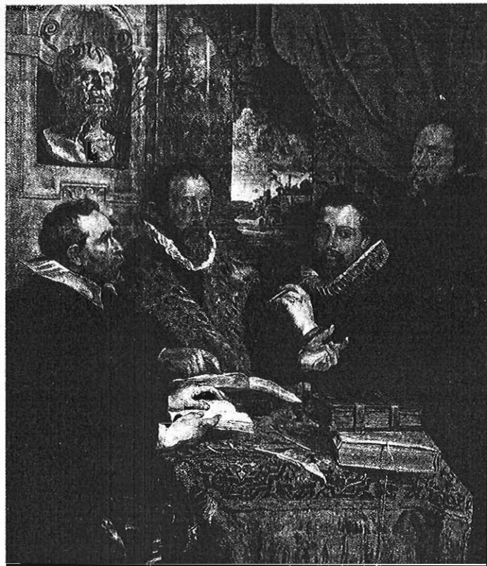
8. Πέτερ Πάουλ Ρούμπενς (1577-1640), «Οι τέσσερις φιλόσοφοι».

Σε αυτό το σημείο θα ήθελα να προβώ σε δύο ισχυρισμούς για την ιστορική σημασία της ηπειρωτικής φιλοσοφίας. Κατ' αρχάς, αποτελεί ουσιαστικά μία επαγγελματική αυτοπεριγραφή : δηλαδή, είναι ένας τρόπος με τον οποίο οι φιλόσοφοι και τα τμή-