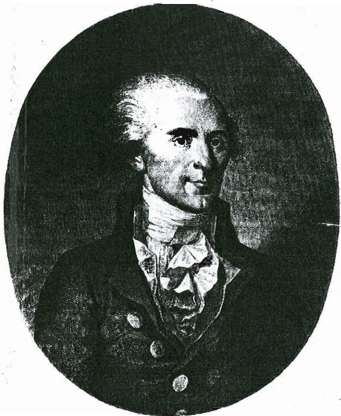
5. Πορτρέτο του Φρήντριχ Χάινριχ Γιακόμπι (1743-1819).