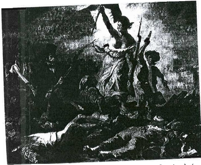
12. Ευγένιος Ντελακρούά (1798-1863), «Η ελευθερία οδηγεί το λαό», 28 Ιουλίου 1830.

φιλεγόμενη έννοια της αποδόμησης πρέπει να προσεγγιστεί με ένα μη εριστικό τρόπο και να γίνει συνεπώς κατανοητή ως μία απόπειρα κριτικής αποδιάρθρωσης της παράδοσης σε σχέση με αυτό που είναι άσκεπτο εντός της και παραμένει προς σκέψη. Με αυτή την έννοια, κάποιος μπορεί να μιλήσει για μία ριζοσπαστική εμπειρία της παράδοσης. Θα προσπαθήσω να γίνω λίγο πιο συγκεκριμένος παρουσιάζοντας δύο ξεχωριστούς ριζικούς τρόπους στοχασμού της παράδοσης, αυτόν του Χούσερλ και εκείνον του πιο φημισμένου φοιτητή του, του Χάιντεγκερ.