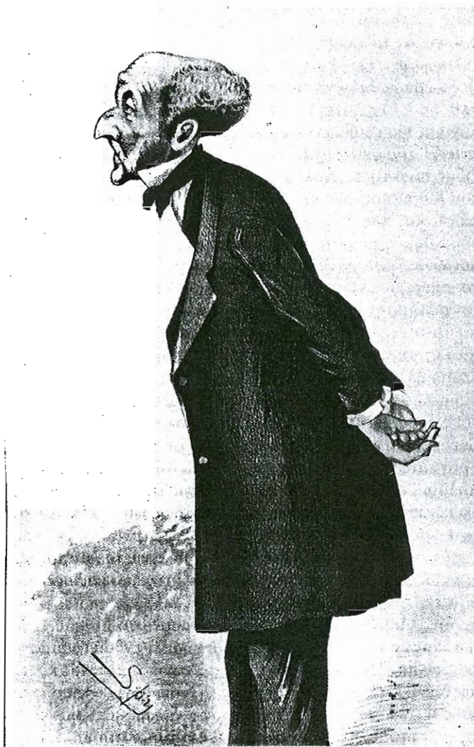
9. Γελοιογραφία του Τζον Στούαρτ Μιλ (1806-73).

φέροντα, θα έχουμε την ευκαιρία να έρθουμε σε επαφή με μία ανάλογη πολιτική διαίρεση στη σύγκρουση του Κάρναπ με τον Χάιντεγκερ, όπου ο πρώτος είναι μεταρρυθμιστής και προοδευτικός, ενώ ο δεύτερος, στο χειρότερό του σημείο, αντιδραστικός και συντηρητικός.