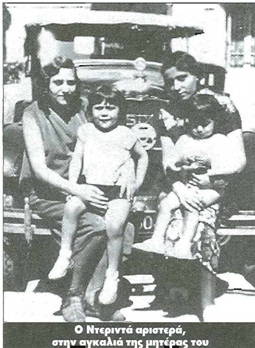
Ο Ντεριντά αριστερά, στην αγκαλιά της μητέρας του

1968 Αντιμετωπίζει την έκρηξη του Μάη του '68 με κάποια επιφύλαξη. Δεν πιστεύει στη «συγκεκριμένη, αυθόρμητη, ενωτική, αντισυνδικαλιστική ευφορία, σ'