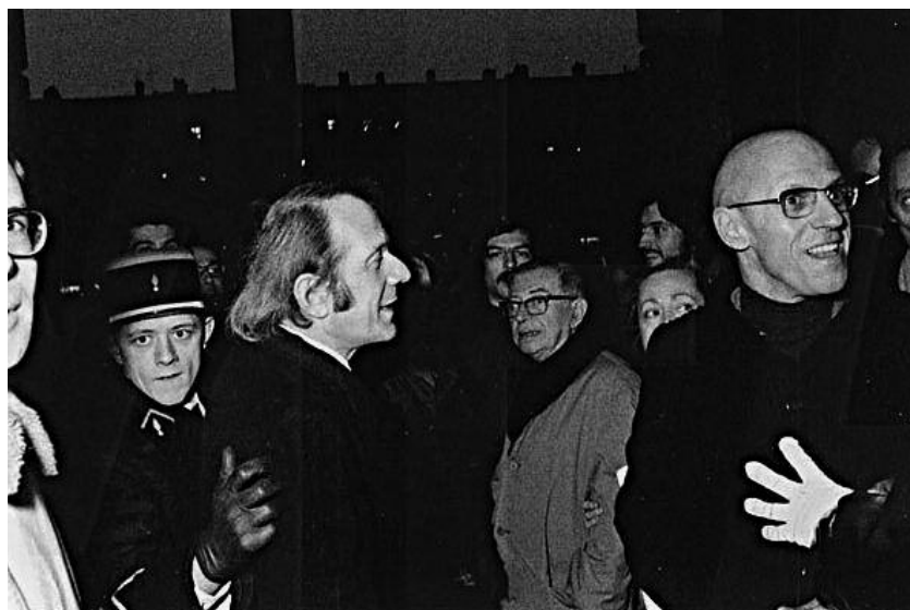
17 Ιανουαρίου 1972. Πωλ Βεν, Ζαν-Πωλ Σαρτρ, Μισέλ Φουκώ.

Από τους ρομαντικούς ιστορικούς ο Πωλ Βεν αναφέρει τον Αυγουστίνου Τιερρύ (Augustin Thierry), παραλληλίζοντας τη μέθοδό του με αυτήν του Φουκώ. Η καινοτομία του Τιερρύ ήταν ότι μελέτησε την αρχαία γερμανική γραμματεία με στόχο να δείξει ότι οι Φράγκοι, που είχαν κατακτήσει τους Γαλατορω-