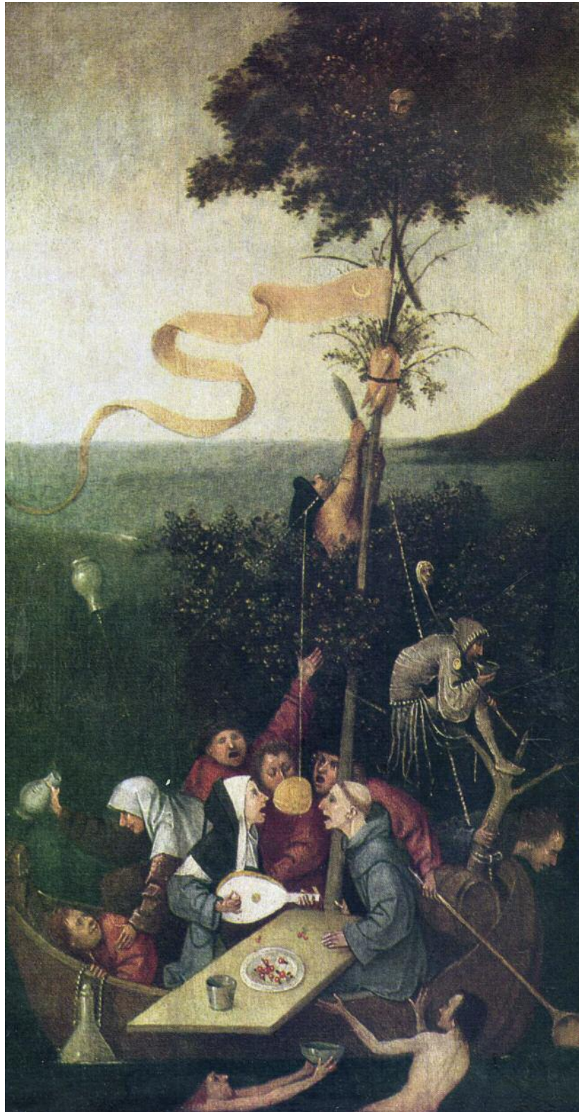
Ιερώνυμος Μπος, Το πλοίο των τρελών, λάδι σε καμβά, 32x58 εκ., 1500.

σικά του ανθρώπου, του ομιλούντος υποκειμένου, αλλά του «λεχθέντος πράγματος» ( Dits et Écrits , τόμος II, σσ. 9-10)