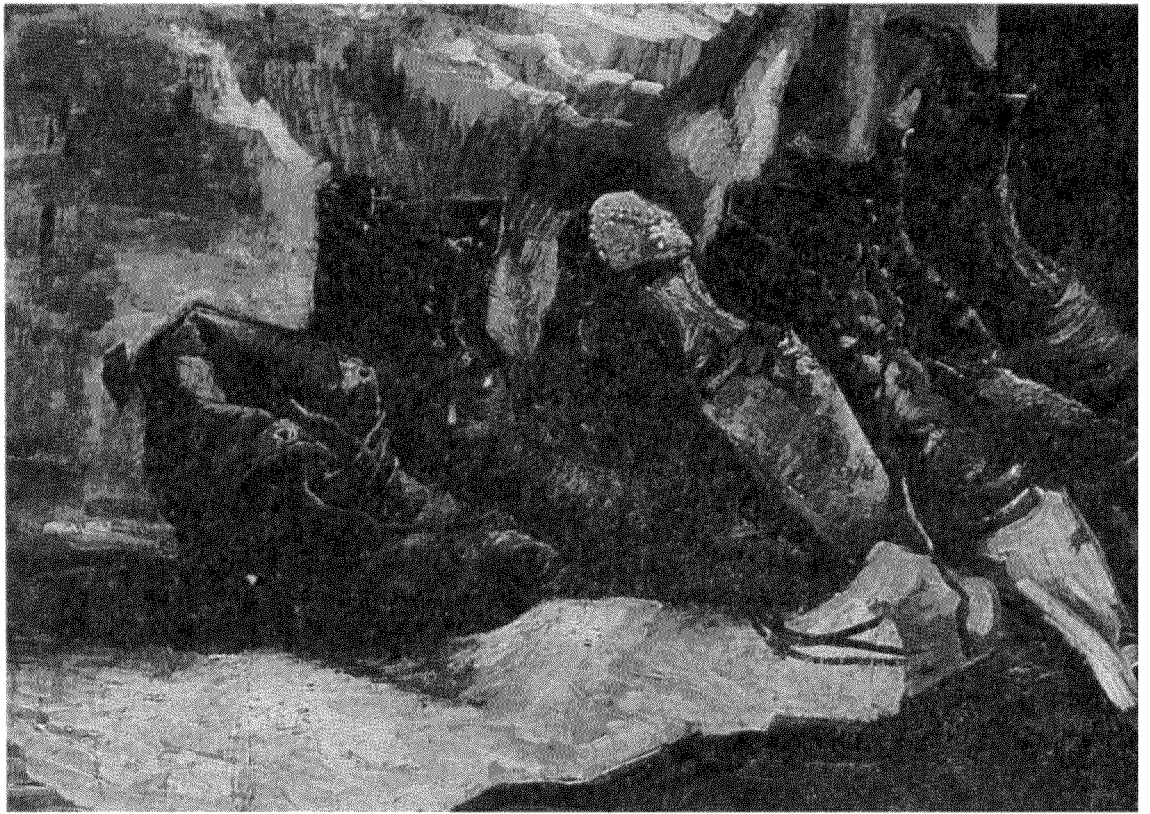
Βίνσεντ Βαν Γκογκ, «Τρία ζευγάρια παπούτσια», 1886-87.